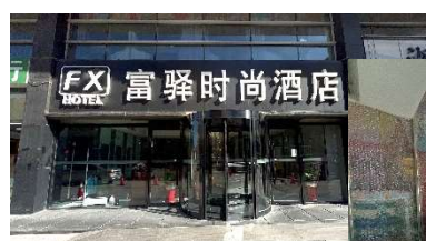
富驛時尚酒店(入口)