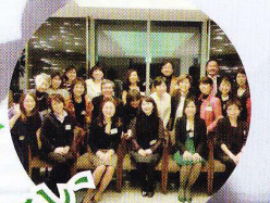
女性経営者交流のひろば