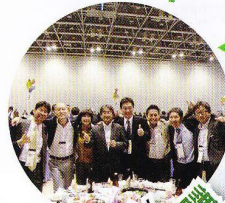
全国大会にも積極的に参加