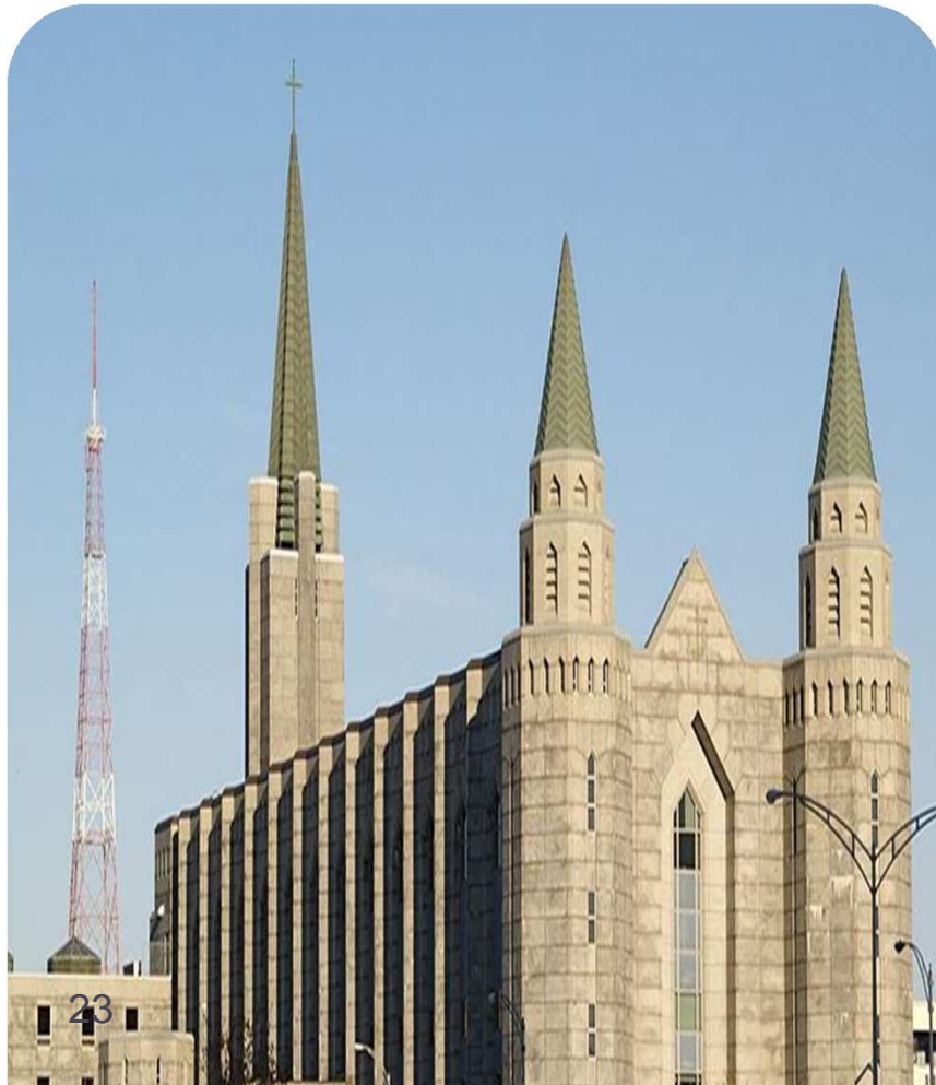
ラヴァル大学 (カナダ・ケベック州・ケベックシティ)