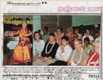
インドでおどったときの新聞記事