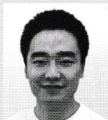
ウ ヤク 于躍

山東省戯曲学院卒業、専門は道化役。在学中は数々のコンクールで賞を受賞。卒業後山東省京劇院に入団。ヨーロッパ・アジアなど海外でも多数公演を経験する。その後北京京劇院、北京風雷京劇団などの合作公演で主役俳優として活躍。2003年来日後、舞台、テレビ、映画などにも参加し活動の場を広げている。