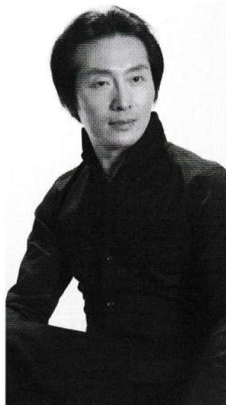
チョウ ショウセイ 張紹成

京劇俳優・演出家・中国武術家。10歳で中国全土の中から選ばれ京劇俳優養成の最高機関である中国戯曲学院に入学、中国の戯曲教育における第一期大学卒業生となる。卒業後、国家京劇院(中国京劇院)の主役俳優を務める。在籍中、北京と台湾の合作京劇映画「挑滑車」に主演、北京映画製作所と香港の合同カンフー映画「絶処逢生」に主演。1989年市川猿之助スーパー歌舞伎の合同公演「リユーオー」に出演、国内外で活躍。人間国宝級の王金璐氏の弟子である。二枚目俳優でありながら女形も演じられる俳優であり、文武両道に優れた役者として希少な存在である。1990年来日。伝統京劇普及のため情熱を注ぐ活動は、2009年TBSテレビ「報道の魂」で取り上げられ反響を呼んだ。京劇と中国文化を通し日中の架け橋として活躍中。中国武術と健康養生にも造詣が深く、それらの経験をもとに作られた『バランスエクササイズ』が好評。全国設計事務所健康保険組合講師、大阪樟蔭女子大学非常勤講師、工学院大学孔子学院 客員研究員。