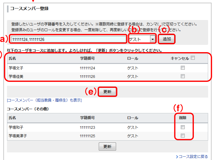
コースメンバー登録画面