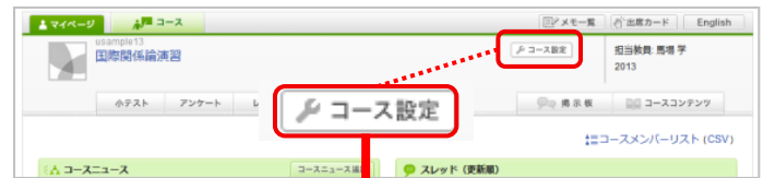
コースストップ画面

「コースメンバー(担当教員・履修生)も表示」をクリックすると、担当教員や履修生の登録メンバーも確認することができます。